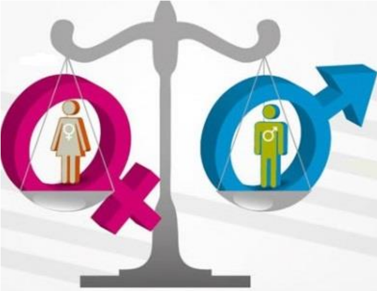
Total plantilla por sexo en TDM